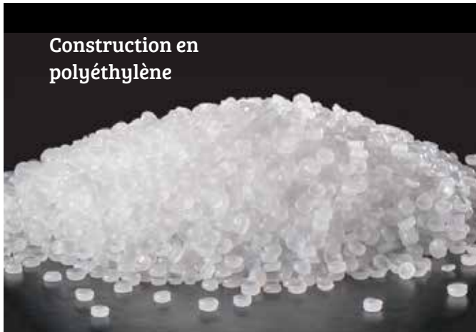
Construction en polyéthylène