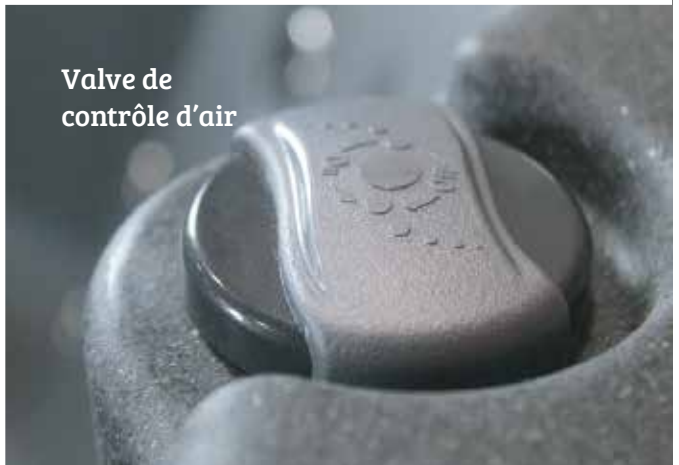
Valve de contrôle d'air