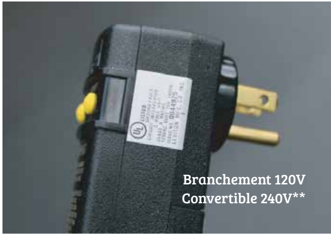
Branchement 120V Convertible 240V**