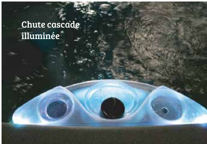
Chute cascade illuminée