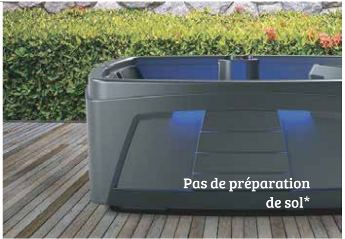
Pas de préparation de sol*