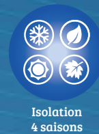
Isolation 4 saisons