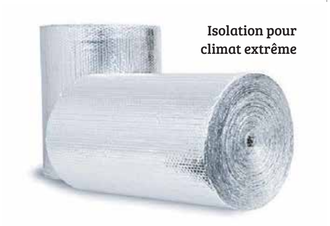
Isolation pour climat extrême