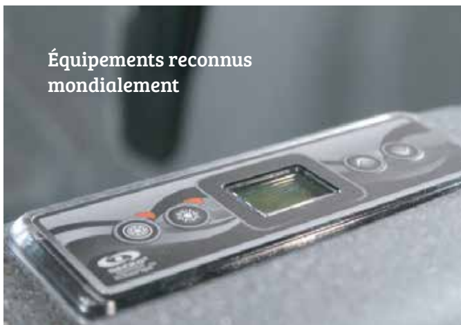
Équipements reconnus mondialement